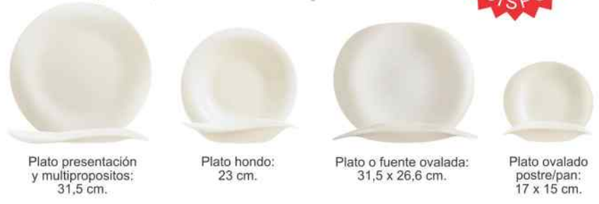
Plato presentación y multipropósitos: 31,5 cm.