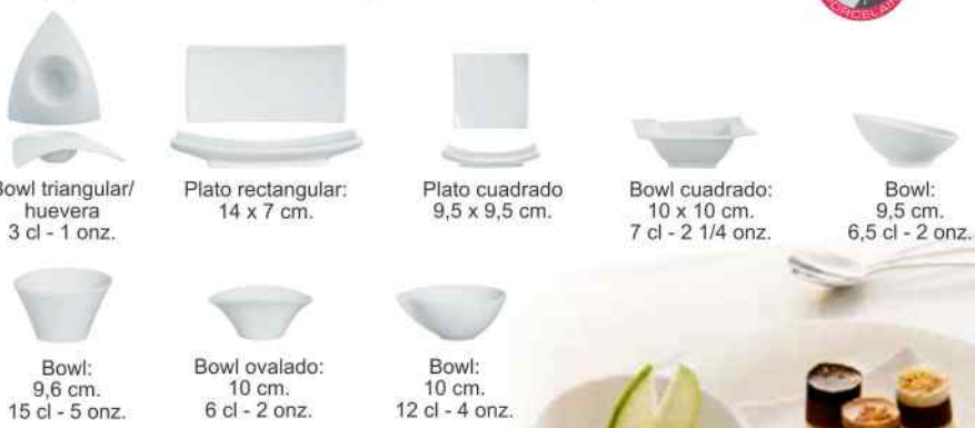
Bowl triangular/huevera: 3 cl - 1 onz.