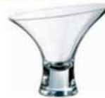
Copa JAZZED Helados/cocteles: 25 cl - 8 1/4 onz.