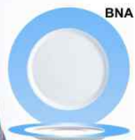
BNA XARANCE Opal Blanco Decorado 31cm. Cód. ITH: 0507561