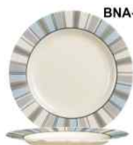
BNA-V CALIA Opal Marfil Decorado 31,5cm. Cód. ITH: 1104802