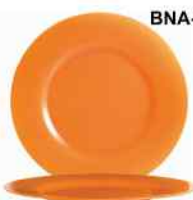
BNA-V SOL ABRICOT Vidrio Templado 32cm. Cód. ITH: 1253872

UBICACIÓN DEL PRODUCTO: BNA: Base Nacional de Almacenes en La Habana H: División ITH La Habana V: División ITH Varadero