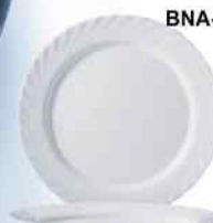
BNA-H TRIANON Opal Blanco Decorado 31cm. Cód. ITH: 1107682