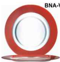
BNA-V Rytmo pimienta Vidrio Templado Decorado 32cm. Cód. ITH: 1081883

UBICACIÓN DEL PRODUCTO: BNA: Base Nacional de Almacenes en La Habana H: División ITH La Habana V: División ITH Varadero