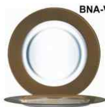
BNA-V Rytmo chocolate Vidrio Templado Decorado 32cm. Cód. ITH: 1081863