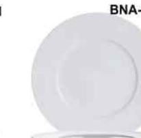
BNA-H-V CANDOUR Porcelana Extra-resistente 31cm. Cód. ITH: 1838172