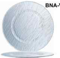
BNA-V Minerali Vidrio Templado Decorado 32cm. Cód. ITH: 1081843