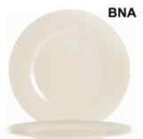
BNA SOL REGLISSE Vidrio Templado 32cm. Cód. ITH: 1253711