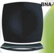
BNA-V DELICE cuadrado Negro Vidrio Templado 26cm. Cód. ITH: 1081364