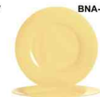
BNA-V SOL PAPRIKA Vidrio Templado 32cm. Cód. ITH: 1314861