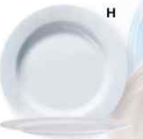
H Evolution Opal Blanco 31cm. Cód. ITH: 1039541