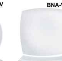
BNA-V DELICE cuadrado Blanco Opal Blanco 26cm. Cód. ITH: 1081434