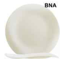
BNA TENDENCY Zenix 31,5cm. Cód. ITH: 1838022